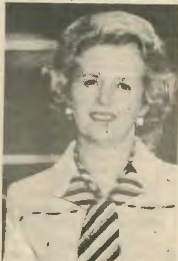
Θάτσερ, ηγέτιδα των Συντηρητικών.

Όποια και να είναι η συγκεκριμένη πορεία των γεγονότων η κρίση του συστήματος στην Βρετανία και γενικότερα στην Εδρώπη δεν πρόκειται να τελειώσει εύκολα. Αναπόφευκτα πρέπει να περιμέ-